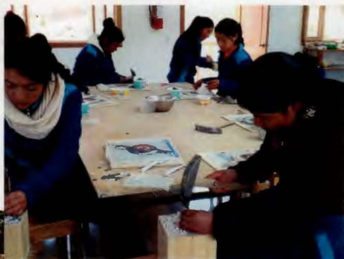
La scuola e il laboratorio