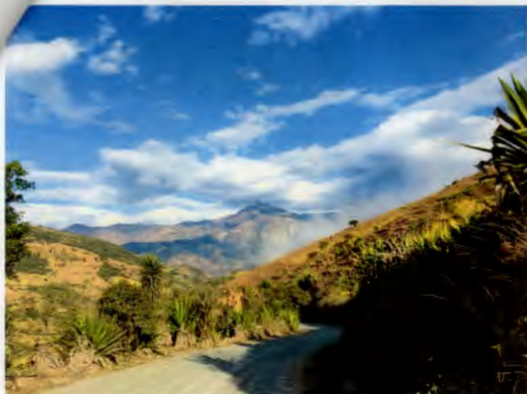
Guanazan, El Oro Ecuador